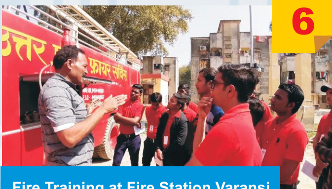
Fire Training at Fire Station Varansi