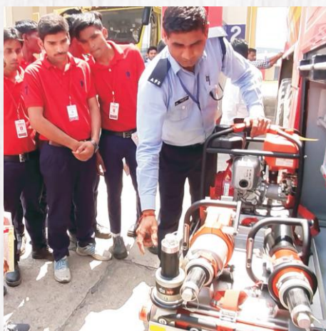
Training By AAI Staff