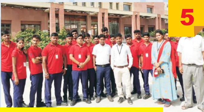
One Day Training at T.F.C , Varanasi