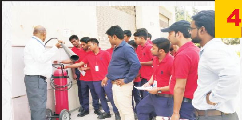
A Practcal Exposure to Real Work Scenerio