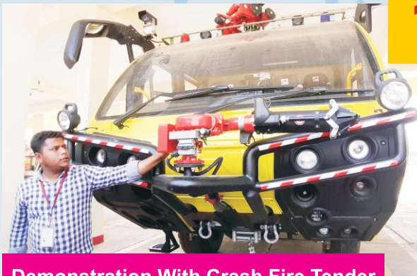
Demonstration With Crash Fire Tender at L.B.S International Airport