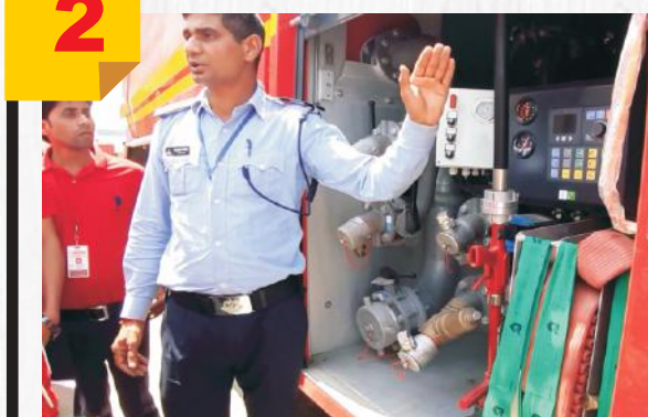
A Practcal Exposure at L.B.S International Airtort