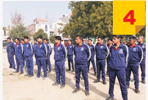
SCFSE FOCUSES ON PRACTICAL ASPECTS