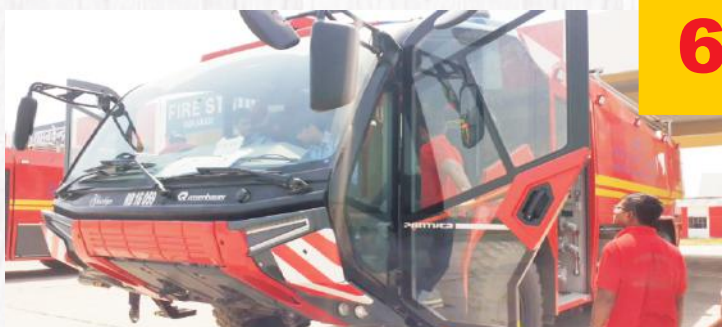
Crash Fire Tender