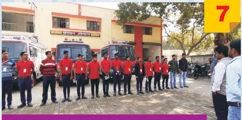
One Day Training at Fire Station , Varanasi