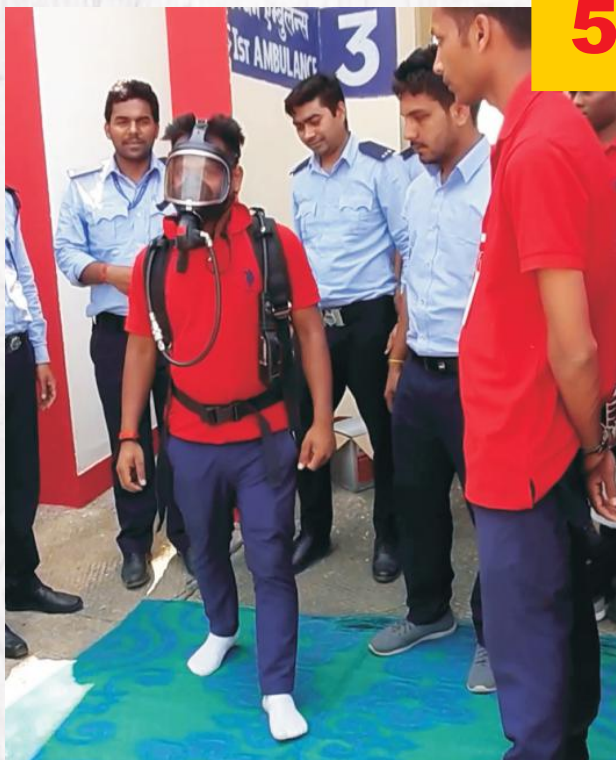
Practical Training of B.A Set