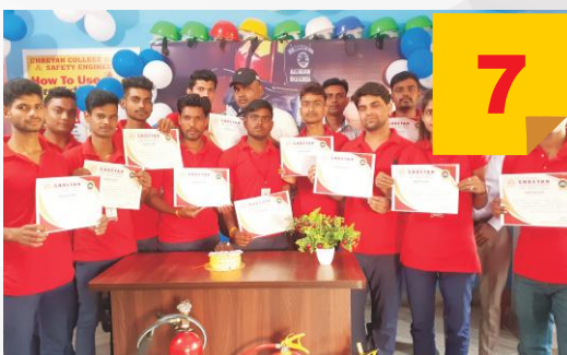
Certificate Distribution of Debate Participation