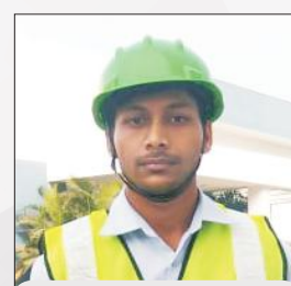
Ayush Belthara Road, Ballia (Fire Man) C.T.C. 2.16 L.P.A