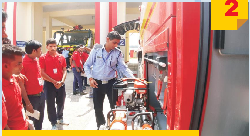
Demonstration With Modern Equipment at L.B.S International Airport