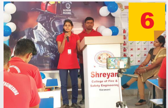
Personality Enhance Programmme