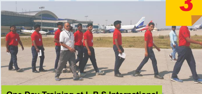
One Day Training at L.B.S International Airport