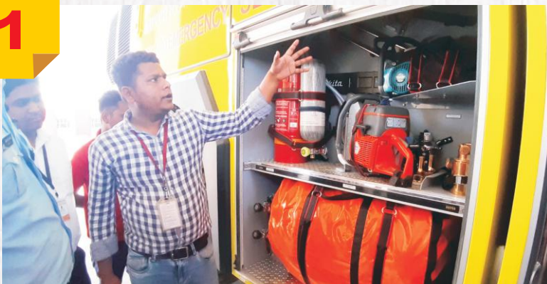
Demonstration with modern Crash Fire Tender Equipment