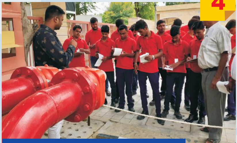
Practical Training of Fire Equipment By Fire Professionals