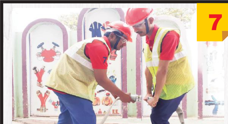
Practical Training With Equipment